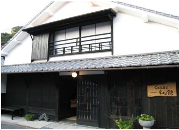
古民家再生 よんでん 和館