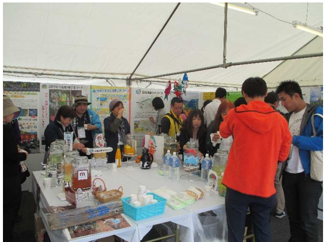
日本ジオパーク全国大会ブロック別パビリオン

また、中四国近畿ブロックよりも比較的参集が容易である四国内のジオパーク関係地域とはより密接なネットワーク形成を進め、事業運営における課題や先行的な施策の共有、ガイド同士の交流を図り、ネットワークの連携強化に努める。