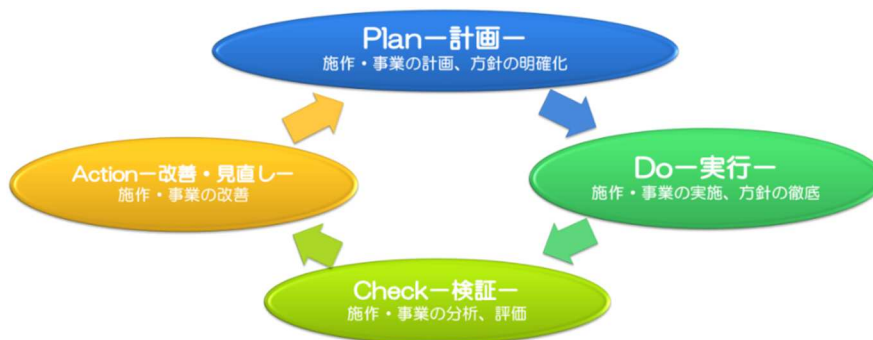
図 11.PDCA マネジメントサイクル

このため、限られた予算を有効に活用し、より円滑な施策・事業を展開するために、Plan-Do-Check-Action（計画-実行-検証-改善・見直し）のマネジメントサイクルを活用する。